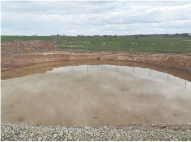
Lietingu oru vėjo elektrinių pamatų duobės prisipildė vandens.