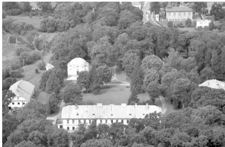
Kartu su Raguvėlės dvaro pastatais parduodama ir 8,3 hektarai žemės.

bimas apie pardavimą, tarp visų Anykščių rajone parduodamų nekilnojamojo turto objektų Raguvėlės dvaras yra brangiausias. Antra pagal kainą – Anykščių rajono tarybos nario, vieno